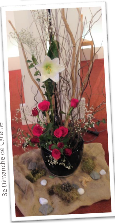
3e Dimanche de Carême