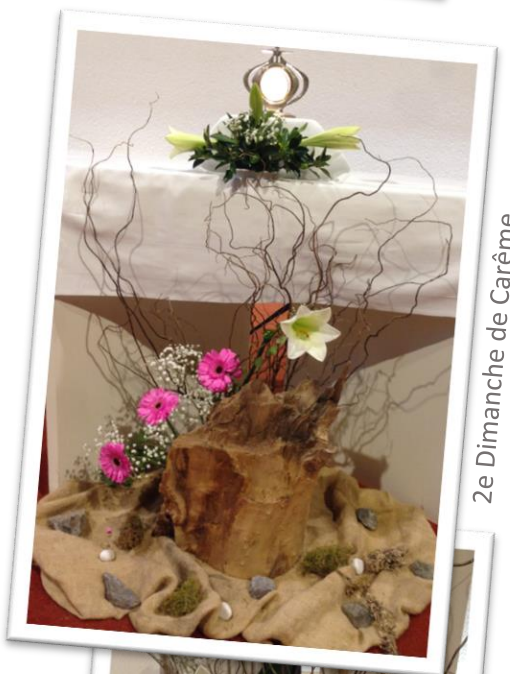
2e Dimanche de Carême