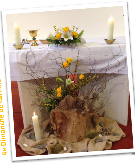
4e Dimanche de Carême – Dimanche de la Joie !