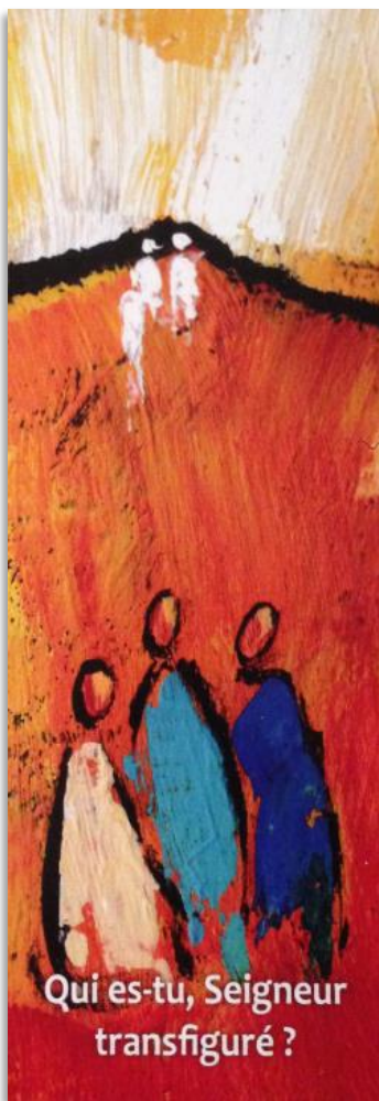
Signet de 'Carême' offert par un paroissien

2 e Dimanche de Carême 28 février 2021 Mc 9, 2-10