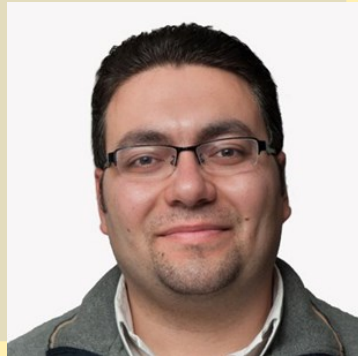
L'ÉDITO DE L'ABBÉ THOMAS-DIBO HABBABÉ